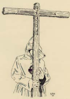
Dibujos: Raúl Ríos