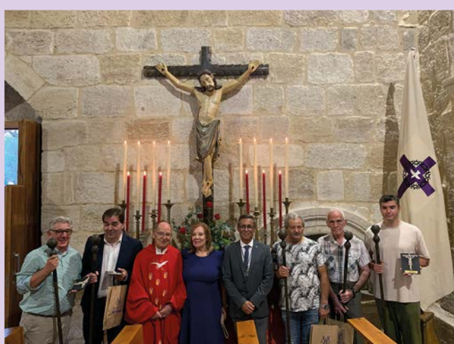
"Mayordomos en la fiesta de la exaltación de la Cruz"